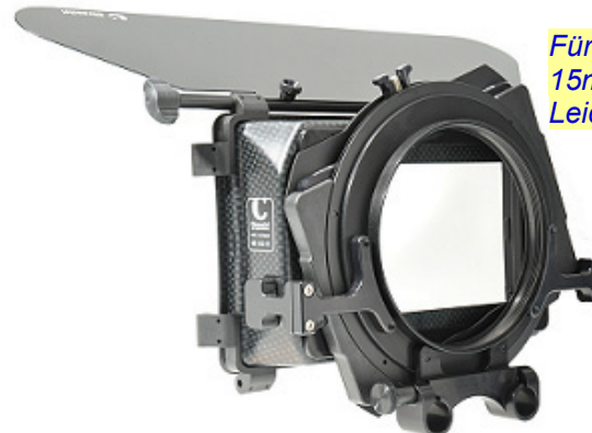
450-R10 MatteBox mit 1 Filtereinschub

Für die Montage der MatteBox ist ein Rohrsystem 15mm erforderlich. Bitte wählen Sie die passende Leichtstütze entsprechend Ihrer Kamera.