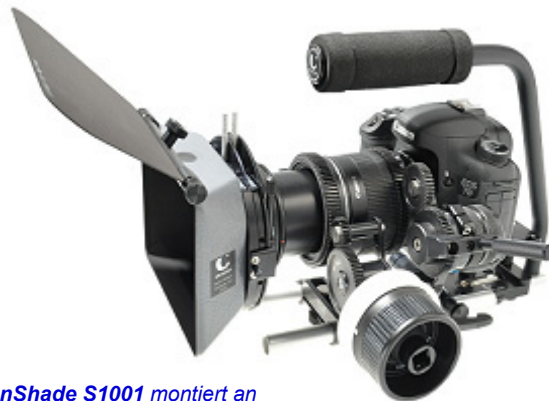
SunShade S1001 montiert an Canon EOS 7D mit Canon EF-S 18-135mm

MatteBoxen bzw. SunShades empfehlen sich zur Verwendung von Glasfiltern und zur Verbesserung der Bildqualität durch Lichtabschattung der Optik. Objektive mit Vorhub bzw. Frontlinsenrotation können evtl. nur mit Einschränkungen verwendet werden.