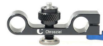
401-34 Objektivstütze mit 1/4" Anschluss