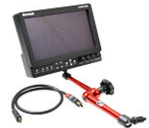
550-50 Monitor Pack Lieferumfang