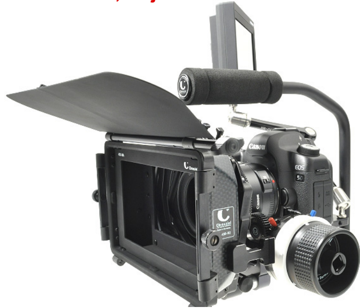
Monitor Paket 550-50 montiert an 1/4" Anschluss der Leichtstütze mit weiterem Chrosziel Zubehör.