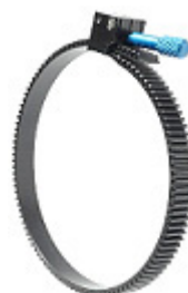
206-30 Zahnkranz, flexibel