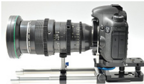
Objektivstütze 401-33 montiert auf den 15 mm Leichtstützen Rohren, zur Entlastung der Objektivfassung an Ihrer Kamera.