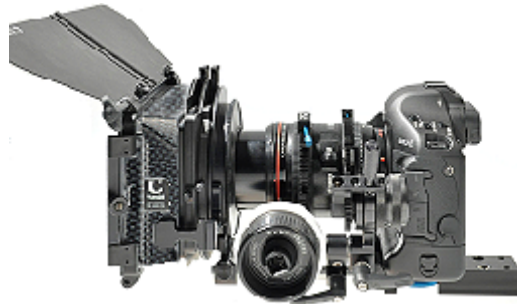
MatteBox 450-R20 mit 450-20 Flexi-Insertring, montiert auf 401-93 Leichtstütze an Canon EOS 1D Kamera.

MatteBoxen bzw. SunShades empfehlen sich zur Verwendung von Glasfiltern und zur Verbesserung der Bildqualität durch Lichtabschattung der Optik. Objektive mit Vorhub bzw. Frontlinsenrotation können evtl. nur mit Einschränkungen verwendet werden.