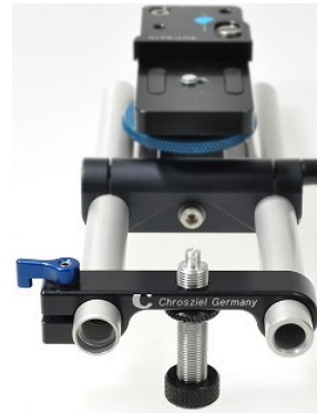
401-33 (auf LWS 401-421S) Objektivstütze mit umgedrehter Stellschraube. Durch den 5mm Zapfen der Schraube kann der Stativanschluss von Teleobjektiven genutzt werden, um das Objektiv zu stützen.