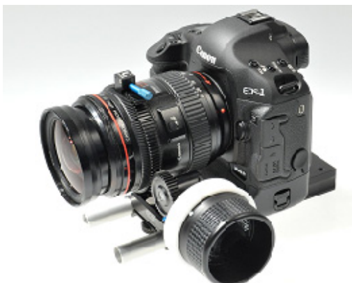
Bild zeigt Canon EOS 1D: montiert mit Einzelkomponenten - bestehend aus: 206-05S-12 DV StudioRig mit Zahnrad mod 0.8 206-30 Zahnkranz flexibel 401-93 Leichtstütze

Bitte Beachten! Für Canon EOS C300/500 LWS 401-94/HD verwenden.