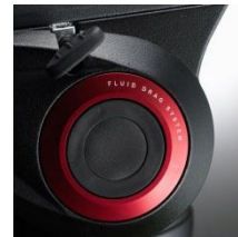
Cartucce Fluide professionali

Kit: MVK500AM testa con treppiede in alluminio a doppia tubo; MVH500AH,755XBK testa con treppiede in alluminio a tubo singolo; MVK500C e MVH500AH,755CX3 testa con treppiede in fibra di carbonio a singolo tubo. Questi kit comprendono una borsa di trasporto imbottita.