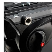
Easy Link per gli accessori