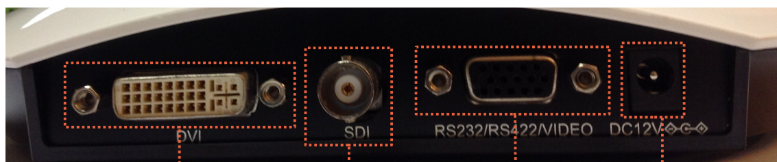
Uscita DVI e VGA