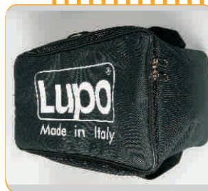
Borsa imbottita per spot Padded bag for Fresnels Cod. 154