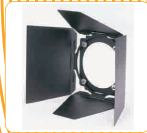
Alette per spot Revolving barndoors for Fresnels Cod. 152