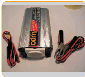
Inverter per spot Inverter for Fresnels Cod. 147