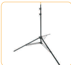
Stativo - Cod. 140 Stand - Cod. 140