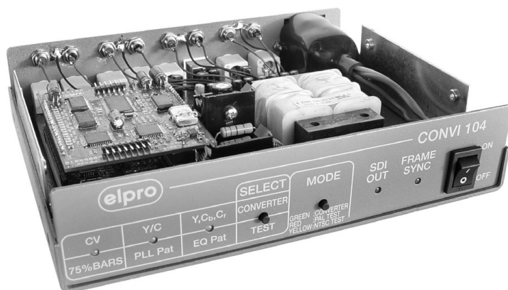
CONVI 104 with FS 104