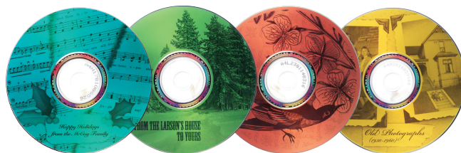
Stampa di etichette per CD/DVD LightScribe Easy