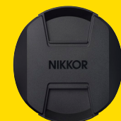
TAPPO ANTERIORE LC-K104