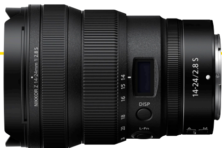
NIKKOR Z 14-24 mm f / 2.8 S