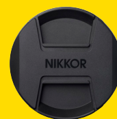
TAPPO ANTERIORE LC-Z1424