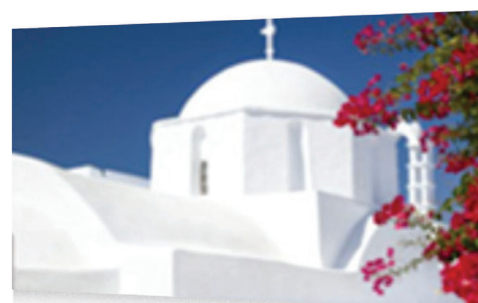
VPL-HW45ES E VPL-HW65ES

Per aumentare la luminosità, i proiettori per Home Cinema tradizionali aumentano il livello dei verdi sacrificando in parte l'accuratezza dei colori. Grazie alle modalità Bright Cinema e Bright TV, VPL-HW45ES e VPL-HW65ES offrono colori e contrasto realistici, anche in ambienti molto illuminati.