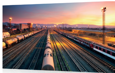
Migliore immagine possibile

Sviluppata per la nostra linea di proiettori per Home Cinema 4K di punta, la tecnologia Reality Creation di nuova generazione riproduce le trame e i colori che vengono persi con il trasferimento dei film su disco. Offre immagini Full HD più chiare e nitide, con una risoluzione che si avvicina a quella originale di 1080p, per un upscaling più riuscito.